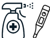
入口での手指消毒と検温