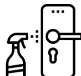
共有部品などの消毒