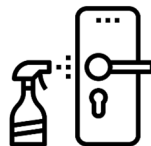
共有部品などの消毒