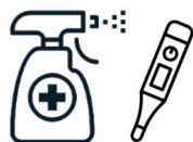
入口での手指消毒と検温